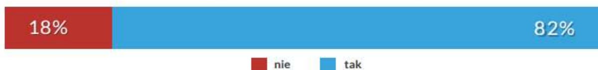
Wykres 1: „Czy Twoje dziecko/dzieci korzysta (ją) z urządzeń mobilnych typu smartfon lub tablet?” Badanie i raport SmartKids N=714, wszyscy badani rodzice

80 proc. dzieci mobilnych rodziców również używa m-urządzeń, tymczasem w rodzinach, gdzie opiekunowie nie używają smartfonów/tabletów („raczej nie korzystam” oraz „nie korzystam”), jest to 45 proc. i 22 proc. Mobilni rodzice są grupą, dla której urządzenia mobilne są urządzeniami codziennego użytku. Najczęściej podkreślają jak wielkim ułatwieniem dla nich jest użytkowanie smartfonów albo tabletów. Należy pamiętać, że dzieci obserwując rodziców wpatrzonych w ekran uczą się pewnych wzorców, podpatrują pewne zachowania dorosłych i chętnie je powielają. Jeżeli rodzic naprawdę często korzysta np. ze swojego smartfona, to dziecko tym chętniej będzie prosić o telefon. Dotyczy to przede wszystkim najmłodszych, którzy biorą przykład z najbliższego otoczenia, jakim jest rodzina. Sytuacja wygląda nieco inaczej w przypadku uczniów szkoły podstawowej, ponieważ w tym środowisku coraz większe znaczenia odgrywają rówieśnicy.