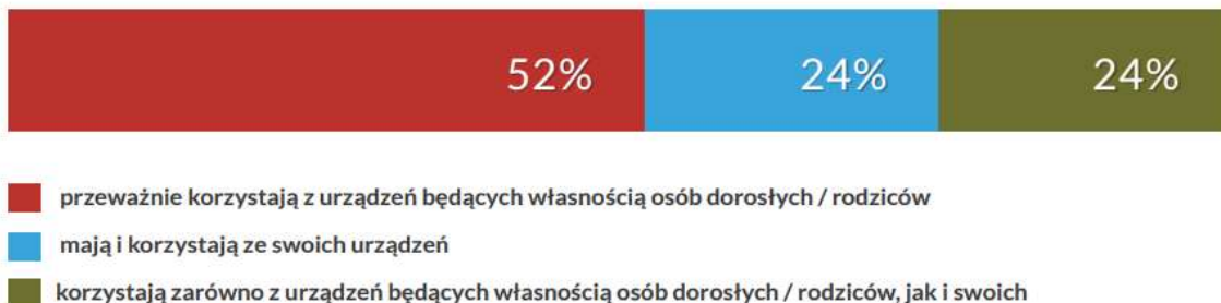
Wykres 4: „Czy Twoje dziecko/dzieci mają własne urządzenia mobilne typu smartfon lub tablet?” Badanie i raport SmartKids, N=585, rodzice, których dzieci korzystają z urządzeń mobilnych

Prawie wszystkie urządzenia mobilne, z których korzystają dzieci, mają dostęp do internetu. Co prawda większość rodziców twierdzi, że kontroluje aktywności dzieci w sieci, to mimo wszystko wśród wymienianych obaw związanych z bezpieczeństwem dzieci, wysoko pojawiają się: narażenie na kontakt z nieodpowiednimi treściami, zainteresowanie nieodpowiednich osobami dzieckiem albo samodzielne zakupy w aplikacjach. Wszystkie wspomniane zagrożenia wiążą się z dostępem do sieci.